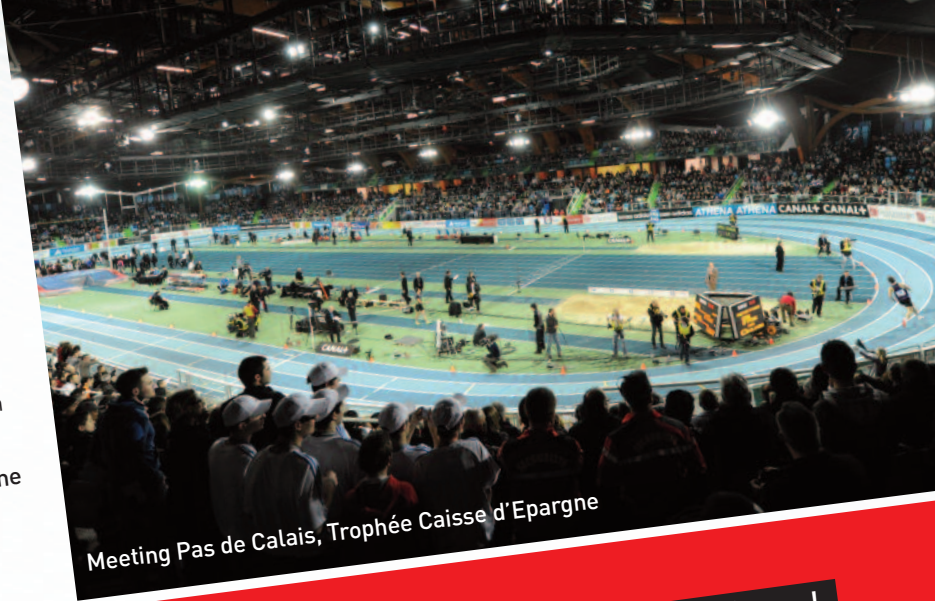
Meeting Pas de Calais, Trophée Caisse d'Épargne

Esprit JO, c'est également des animations en agence, des cartes bleues aux couleurs de l'olympisme, une campagne d'affichage en agence et des jeux concours organisés pour faire gagner aux clients des séjours à Londres pendant les JO.